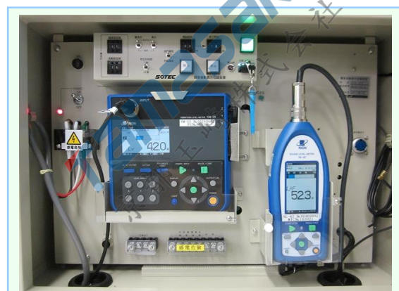
SVD450 内部 (騒音計は同等品に変更になります)